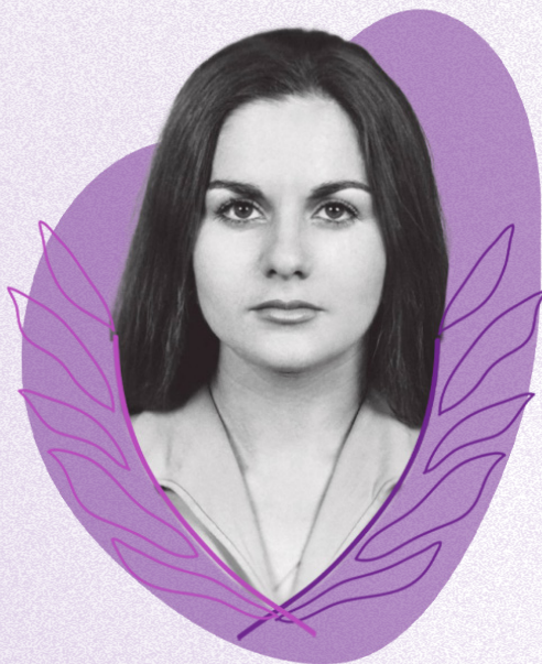
Maria da Penha Maia Fernandes ativista do direito das mulheres

É possível perceber que a violência sexual e a violência moral muito se assemelham às violências apresentadas, porém somente incidirá a aplicação da Lei Maria da Penha nos casos em que o (a) acusado (a) mantenha ou tenha mantido uma relação de afeto com a vítima.