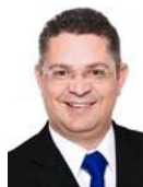
2º Vice-Presidente Sóstenes Cavalcante (PL-RJ)