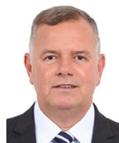
4º Secretário Lucio Mosquini (MDB-RO)