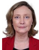
2º Secretária Maria do Rosário (PT-RS)