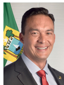
4º Secretário Styvenson Valetim (Podemos-RN)