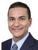
1º Vice-Presidente Marcos Pereira (Republicanos-SP)