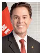
1º Vice-Presidente Veneziano Vital do Rego (MDB-PB)