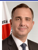
Presidente Rodrigo Pacheco (PSD-MG)