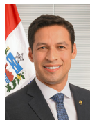
2º Vice-Presidente Rodrigo Cunha (União-AL)