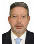
Presidente Arthur Lira (PP-AL)