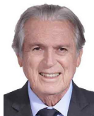
1º Secretário Luciano Bivar (UNIÃO-PE)